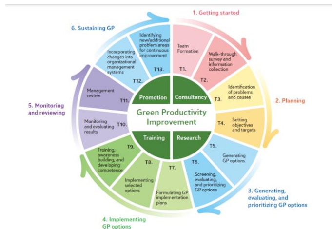
Figure 1. Framework for Green Productivity improvement

1 สร้างองค์ความรู้และพัฒนาทักษะในด้านการผลิตสีเขียวและความยั่งยืน โดยได้เน้นหลักการประยุกต์ใช้เครื่องมือต่างๆของการบริหารการผลิตที่ยั่งยืน และแนวคิดพื้นฐานขั้นตอนการดำเนินการประยุกต์ใช้ 6 ขั้นตอน 13 งาน โดยเริ่มจากการสำรวจกำหนดหัวข้อการปรับปรุงไปจนถึงการดำเนินงานและการรักษาผลการปรับปรุงให้เป็นมาตรฐาน การออกแบบผลิตภัณฑ์ที่เป็นมิตรต่อสิ่งแวดล้อม การวางแผนออกแบบและดำเนินการผลิตรวมถึงการสร้างบรรทัดฐานหรือการบริหารการจัดส่งโลจิสติกส์ที่เป็นมิตรต่อสิ่งแวดล้อม