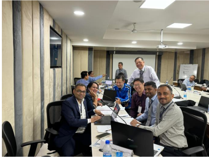
ภาพ 2 การทำกิจกรรมกลุ่มเรียนรู้ผ่านประสบการณ์ของผู้เข้าอบรมเชิงบูรณาการ

3 ฝึกทำกิจกรรมการตรวจรับรองผู้ขอรับการประเมิน โดยนำเสนอเป็นกลุ่มเกี่ยวกับ การพัฒนา checklist ที่ครอบคลุมข้อกำหนดของ GPS201 ที่จำเป็นต้องใช้สำหรับหน่วยตรวจประเมินรับรอง และนำเสนอผลงานการเรียนรู้ แลกเปลี่ยนประสบการณ์กับสมาชิกในกลุ่ม เกี่ยวกับการตรวจผลรายงานการปรับปรุงสถานประกอบการและโรงงานของผู้ขอรับการประเมินเทียบกับข้อกำหนดความต้องการ การฝึกประเมินการให้การรับรองผู้เชี่ยวชาญด้าน GPS รวมถึงการฝึกทักษะการขยายผลการพัฒนากำลังคนเพื่อการพัฒนา ด้านการเพิ่มผลผลิตที่เป็นมิตรต่อสิ่งแวดล้อม รวมถึงเรื่องการใช้พลังงาน และการลดมลพิษให้แก่สถานประกอบการ