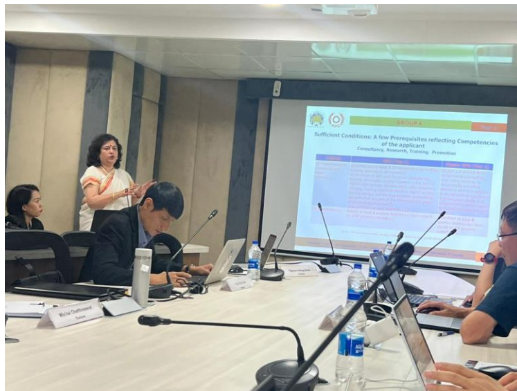
ภาพ 3 ฝึกทำกิจกรรมการตรวจรับรองผู้ขอรับการประเมิน

3 ฝึกทำกิจกรรมการตรวจรับรองผู้ขอรับการประเมิน โดยนำเสนอเป็นกลุ่มเกี่ยวกับ การพัฒนา checklist ที่ครอบคลุมข้อกำหนดของ GPS201 ที่จำเป็นต้องใช้สำหรับหน่วยตรวจประเมินรับรอง และนำเสนอผลงานการเรียนรู้ แลกเปลี่ยนประสบการณ์กับสมาชิกในกลุ่ม เกี่ยวกับการตรวจผลรายงานการปรับปรุงสถานประกอบการและโรงงานของผู้ขอรับการประเมินเทียบกับข้อกำหนดความต้องการ การฝึกประเมินการให้การรับรองผู้เชี่ยวชาญด้าน GPS รวมถึงการฝึกทักษะการขยายผลการพัฒนากำลังคนเพื่อการพัฒนา ด้านการเพิ่มผลผลิตที่เป็นมิตรต่อสิ่งแวดล้อม รวมถึงเรื่องการใช้พลังงาน และการลดมลพิษให้แก่สถานประกอบการ