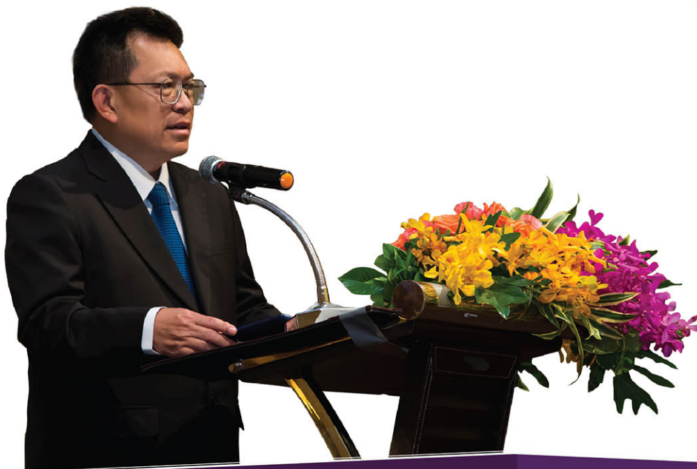
ดร.สมชาย หาญหิรัญ ปลัดกระทรวงอุตสาหกรรม

ผมพูดเสมอว่าชีวิตการทำงานของใครสักคน เราไม่ได้วัดกันที่ตำแหน่ง หรือภารกิจสุดท้ายของการทำงาน ถ้าเรารักองค์กร เราต้องสามารถเดินออกจากองค์กรนั้นได้ และมั่นใจว่า องค์กรนั้น สามารถอยู่ได้โดยไม่มีเรา และ ต้องดีกว่าเดิม ซึ่ง ในช่วงที่เราอยู่ในองค์กร จะต้องสร้างคนขึ้นมาผ่านกระบวนการ KM โดย Facilitator ต้องมีหน้าที่กระตุ้น และจัดการองค์ความรู้ เพื่อให้คนรุ่นหลังนำวิทยาการใหม่ๆ มาเสริมองค์ความรู้เหล่านั้น ซึ่งจะนำไปสู่การพัฒนาองค์กรอย่างต่อเนื่อง ดังนั้น Facilitator ต้องสร้างคน กระตุ้นให้คนทำงาน กระตุ้นจิตวิญญาณ และกระตุ้นให้ทำงาน ต่อยอดเราให้ได้