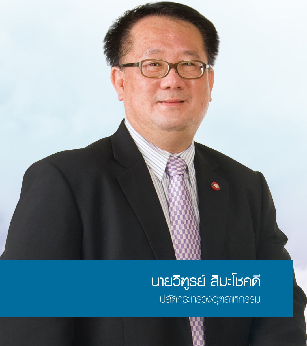
นายวิฑูรย์ สิมะโชคดี ปลัดกระทรวงอุตสาหกรรม

สถาบันเพิ่มผลผลิตแห่งชาติ ในฐานะสถาบันเครือข่ายของกระทรวงอุตสาหกรรม ได้ดำเนินงานเพื่อตอบสนองนโยบายของรัฐบาลและกระทรวงอุตสาหกรรมอย่างต่อเนื่องท่ามกลางความผันผวนทางเศรษฐกิจและการเมือง ที่ท้าทายพันธกิจของสถาบันในการยกระดับผู้ประกอบการให้มีความสามารถในการแข่งขันทั้งภายในประเทศและระหว่างประเทศต่อไป