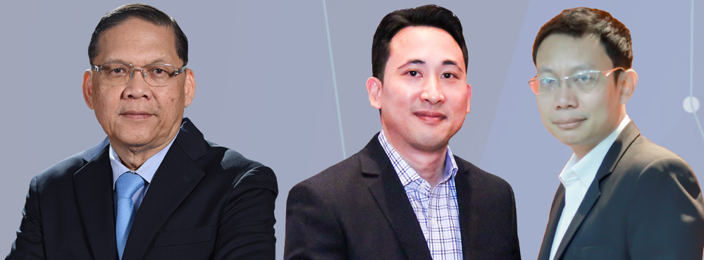
รศ.ดร.กlahanรงค์ ศรีรชอด กรรมการ และ ผู้อำนวยการ ศูนย์นวัตกรรมและวิจัยมิตรผล